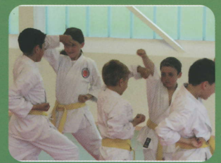
Kinder ab 6 Jahren Junioren ab 13 Jahren

telefon 055 240 66 22 e-mail: priska.kraeutli@hispeed.ch