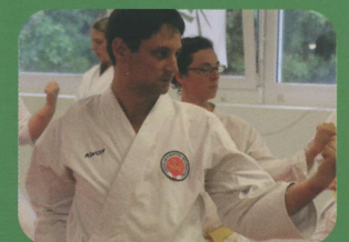
Karate ab 35 Jahren